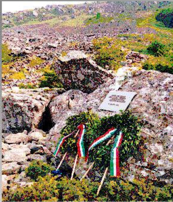
Monte Ventasso RE, 12 ago '90: bassa visibilità, impatto con monte